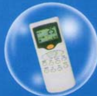
Remote Control ไร้สายแบบ Digital