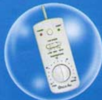
Remote Control มีสายแบบ Analog

เครื่องปรับอากาศแยกส่วนชนิดตั้งพื้น / แขนงใต้ฟ้า (Floor / Ceiling Type Airconditioner)